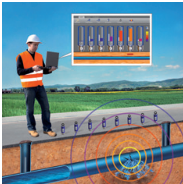
Точная локализация показывает, под каким датчиком находится утечка.