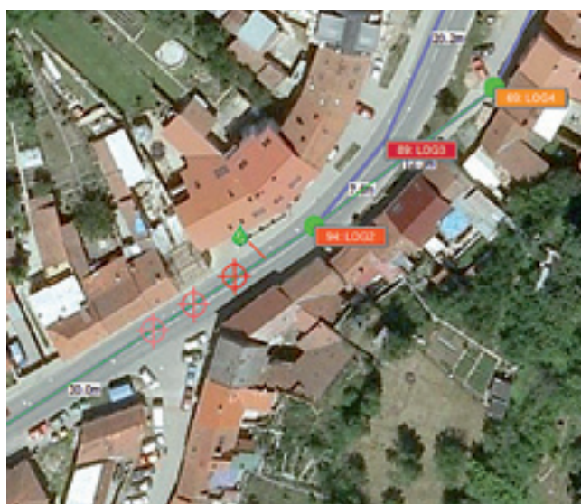
Навигатор ведет пользователя при помощи GPS к месту утечки.