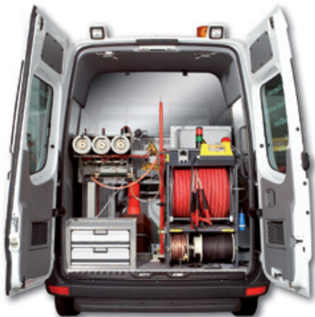
Пример возможного вида сзади на высоковольтный отсек

Себа Спектрум · 2-ой Рощинский проезд, 8 · 115419 Москва, Россия · Тел./ Факс: +7 495 234 91 61 · e-mail: sebasp@sebaspectrum.ru · Представительство Себа Динатроник в Украине · ул. Марины Расковой, 21, офис 904 · 02660 Киев · Тел./Факс: +38 044 517 40 94 · Представительство Себа Динатроник Беларусь · ул. Тимирязева 65 Б, офис 1205, 220035 Минск · Тел: +375 (17) 290 8512, Факс: +375 (17) 290 8407