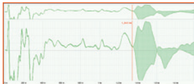
Типичная рефлектограмма IFL

Поэтому не надо знать точное время, когда возникает изменение, так как оно сразу же и надолго остается видимым. Эта функция позволяет легко определять места разветвлений в низковольтных сетях.