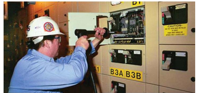
Тестирование выключателей в литом корпусе, используя HCP2000