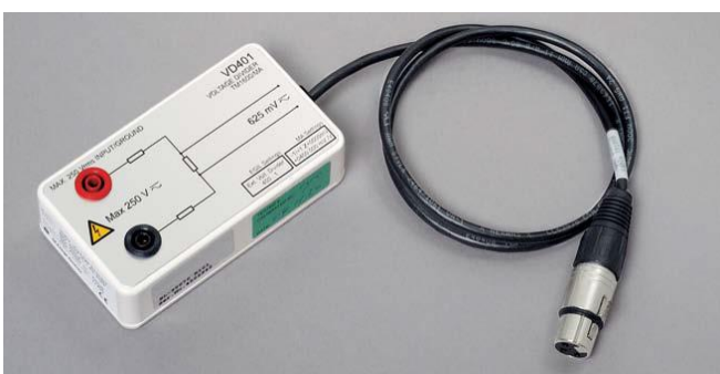
Делитель напряжения, VD401