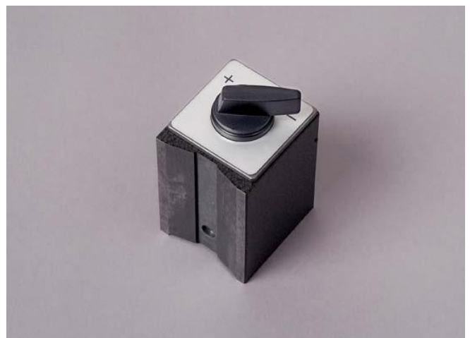
Включаемое магнитное основание