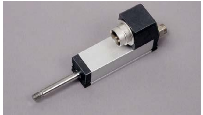
Линейный датчик, TS 25