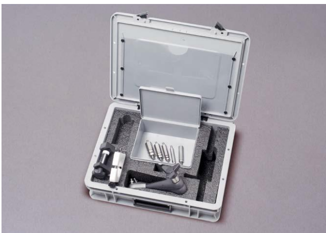
Набор для монтажа угловых датчиков